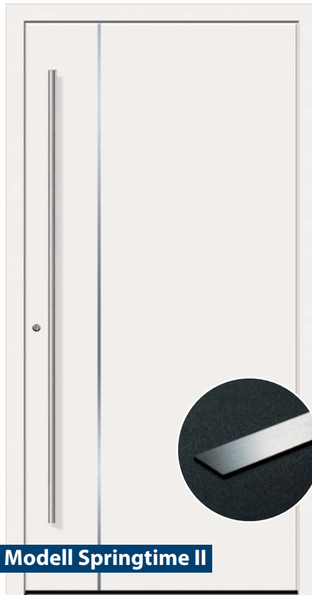
Modell Springtime II