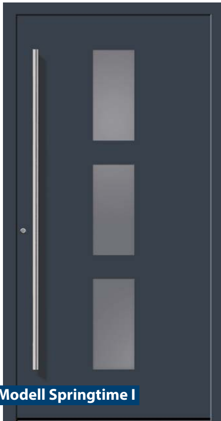
Modell Springtime I