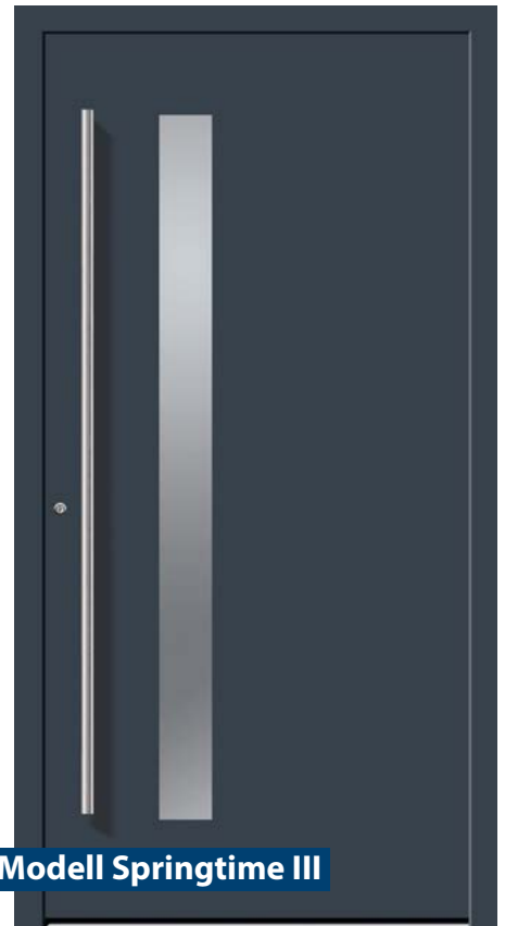
Modell Springtime III